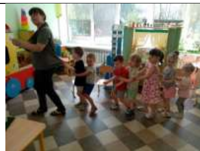
Дети отвечают на вопросы

Педагог уточняет: «Сколько мячей у вас в руках? А сколько мячей сейчас в корзине? Положите мячи в корзину. А сколько сейчас у вас мячей? А сколько сейчас мячей в корзине?»