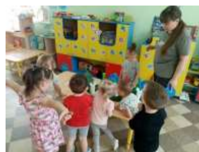
Дети внимательно слушают рассказ педагога. Отвечают на вопросы